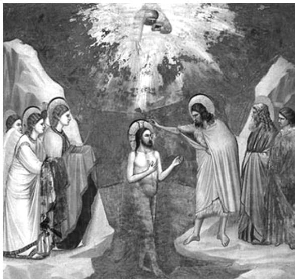
Battesimo di Cristo - Giotto

Ma lui, l'Agnello innocente, veniva a prendere su di