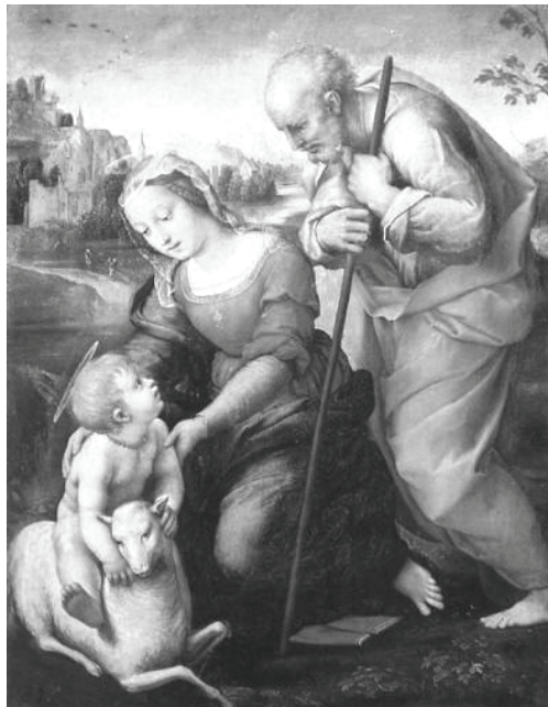
SACRA FAMIGLIA CON L'AGNELLO (Raffaello Sanzio - 1507)

Nell'attuazione di tale compito, egli ha vissuto la mag-