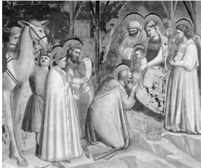
Adorazione dei Magi - Giotto

Oggi, 6 gennaio, è la solennità dell'Epifania del Signore, una festa molto antica, che ha la sua origine nell'Oriente cristiano. L'Epifania mette in risalto il mistero della manifestazione di Gesù Cristo a tutte le genti, rappresentate dai Magi che vennero ad adorare il Re dei Giudei appena nato a Betlemme, come narra il Vangelo di san Matteo.