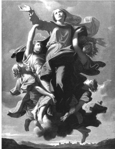
Maria Assunta - N. Poussin (sec. XVII)

Maria ci aiuti, ci incoraggi a far sì che ogni momento della nostra esistenza sia un passo in questo esodo, in questo