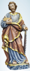
A te glorioso San Giuseppe, patrono della Chiesa e custode della Santa Famiglia, consacriamo la nostra Comunità, la nostra Chiesa e le nostre Famiglie: custodiscile nell'amore e nella pace

In questa Terza Settimana di Quaresima vi invitiamo a sintonizzarvi in diretta con noi in due sere.