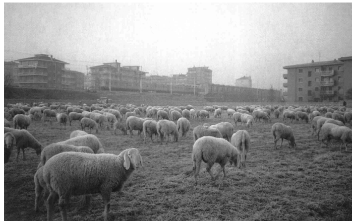
[Cassina de' Pecchi - “In una mattina d'inverno” ...“un tempo era un territorio ubertoso di pascoli, cereali e gelsi...”]